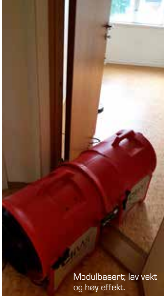
Modulbasert; lav vekt og høy effekt.