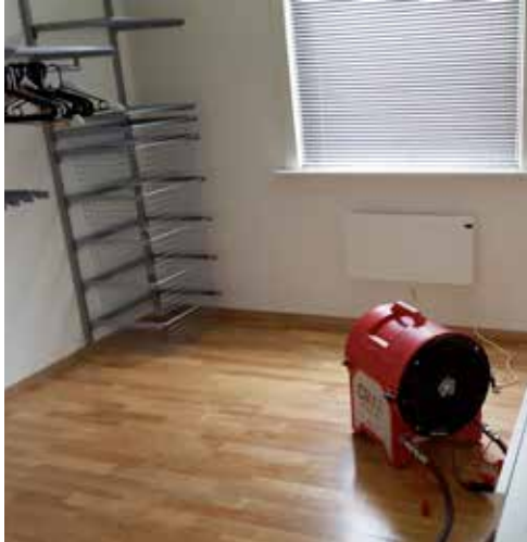
Skadesanering; veggedyr - bedbugs