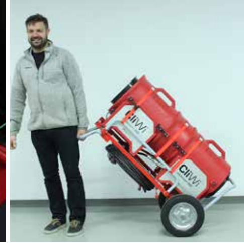
Enkelt å transportere med vogn