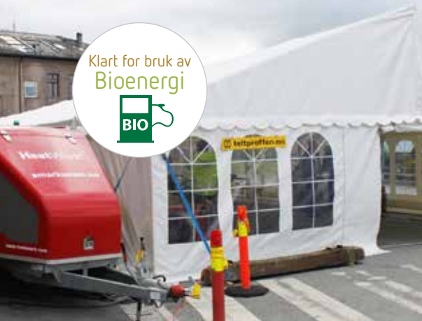
Oppvarming; telt, garasje, bygninger