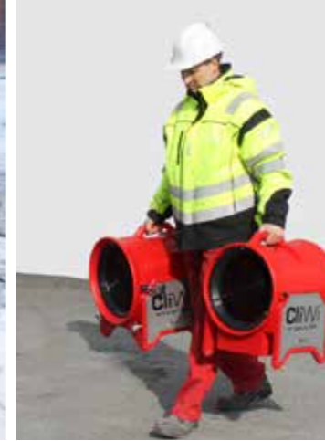
Modulbasert; lav vekt og høy effekt