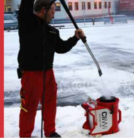
Kan enkelt rengjøres med f.eks høytrykkspyler