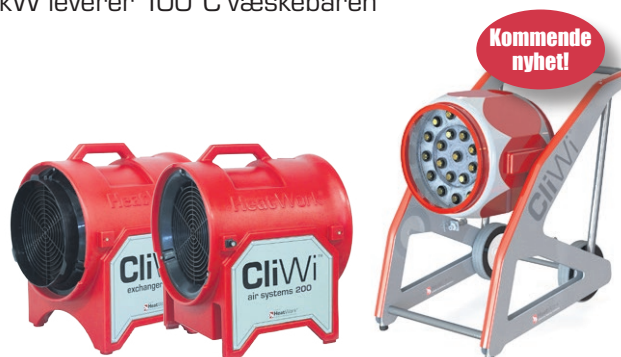
CliWi 200 og 300 • 18 - 30 kW fra 1100 - 3400 m 3 /t luft

CliWi Green Air gir ingen helseskadelige brente partikler/støv, har ingen åpen flamme og avgir hverken gift, lukt, fukt eller avgasser.