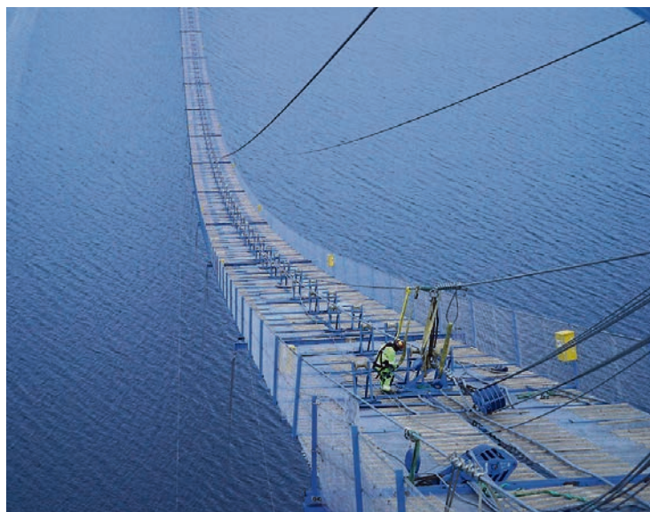
SIKRET: Arbeidere på cat walk'en henger fortsatt i en stropp etter at forankringen til cat walk'en røk. Snart skal den være reparert.