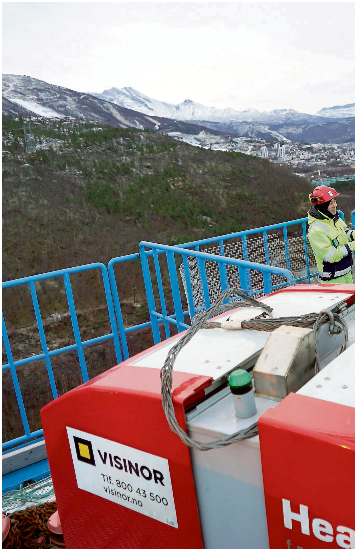
180 M.O.H.: Med Rombakstøtta som vitne, ble varmeaggregatet som er produsert svingt inn over toppen på brutårmet. De tid - og lot seg overraske over at svaret lå i et svært kompetent miljø rett i nærheten av der brua bygges. Men miljøet sliter med