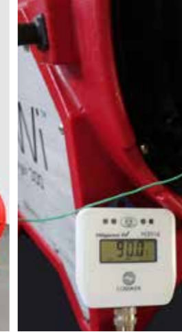
Temperaturlyft upp till 90°C. Lätt att transportera med vagn.