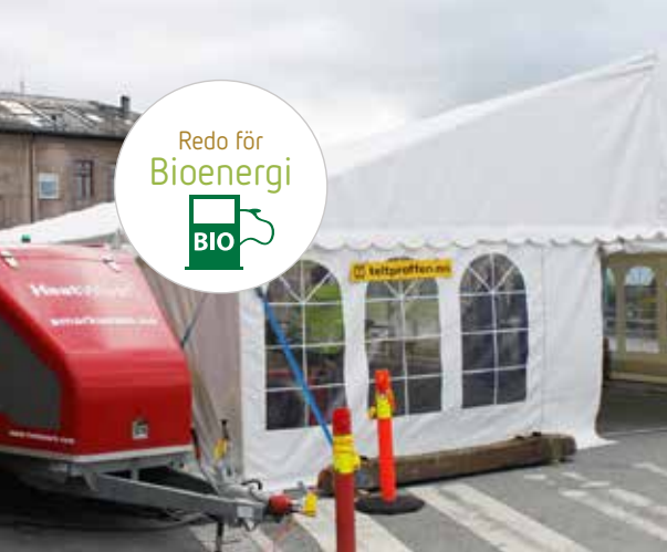
Uppvärmning; tält, garage, byggnader