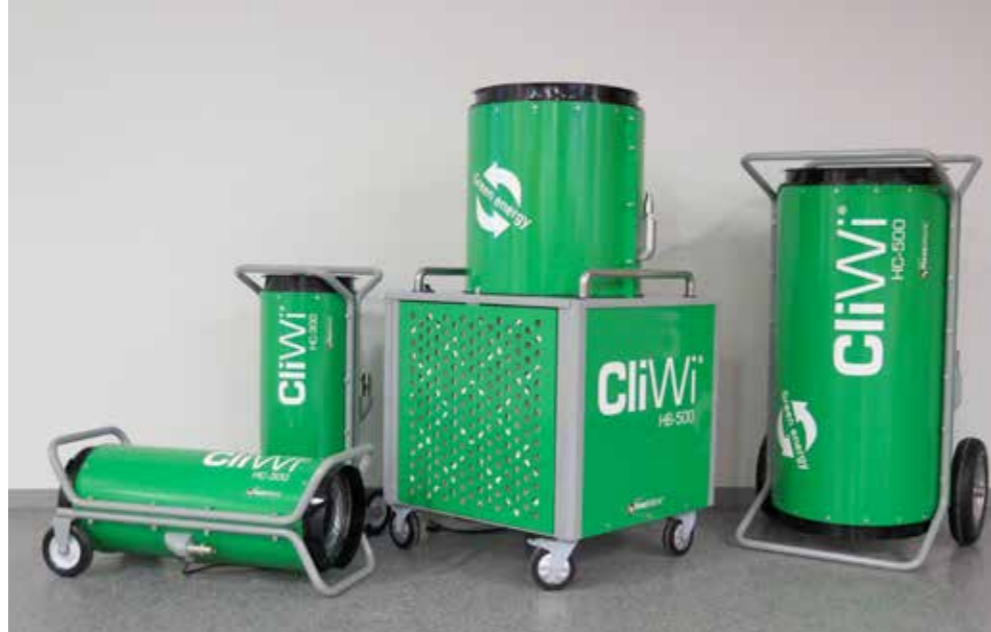
UUTUUS! Ei myrkyä, hajua, kosteutta tai pakokaasuja