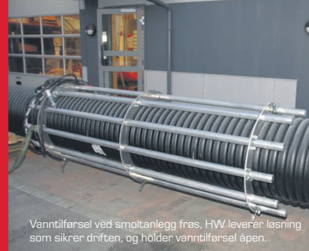
Vanntilførsel ved smoltanlegg frøs, HW leverer løsning som sikrer driften, og holder vanntilførsel åpen.